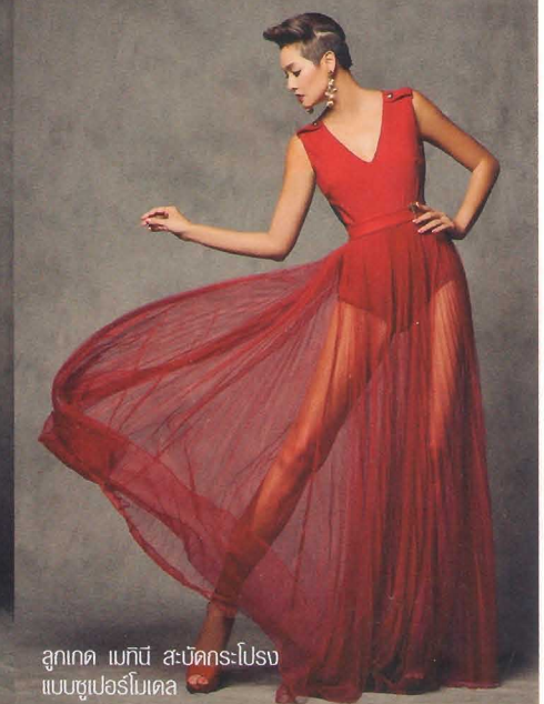
ลูกเกด เมกนี สะบัดกระโปรง แบบซูเปอร์โหด